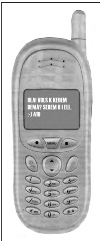
QUADRE 20 Missatge de mòbil

En el cas del xat, el fet que hi intervinguin un nombre indeterminat de locutors fa que sigui una mica complicat de seguir els diàlegs encreuats que se succeeixen: 29